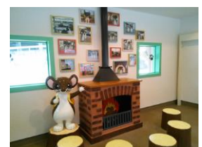
津川駅・オコジロウの家(イメージ)