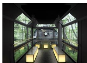
グリーン車両(イメージ)