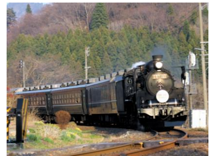
SLばんえつ物語(イメージ)