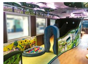
オコジョ展望車両(イメージ)