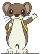
オブジェ(イメージ)

室内には「木の切り株」の形をしたベンチや「暖炉」、ホームにはオコジロウのオブジェもあって、オコジロウが暮らしている雰囲気を楽しめるよ。