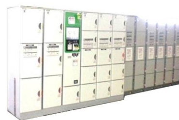
コインロッカー(イメージ)