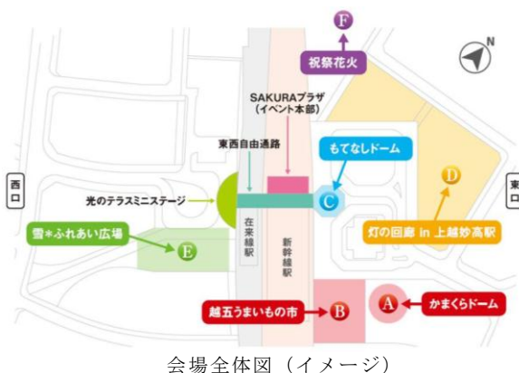
会場全体図(イメージ)

■ご案内 イベントの詳細は http://echi5.jp でご確認ください 会場には駐車場がございません。公共の交通機関をご利用ください。