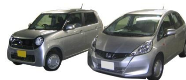
レンタカー(イメージ) [Kクラス・Sクラス]