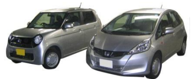
レンタカー(イメージ) [Kクラス・Sクラス]