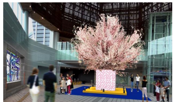
もてなしドーム内 越五夢サクラ(イメージ)