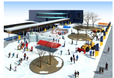
雪*ふれあい広場(イメージ)

■ご案内 イベントの詳細は http://echi5.jp でご確認ください 会場には駐車場がございません。公共の交通機関をご利用ください。