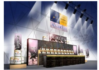
新潟淡麗BAR(イメージ)

■場所 上越妙高駅自由通路および駅周辺 ■主催 新幹線まちづくり推進上越広域連携会議 ■内容 イベント会場への入場は無料(飲食・物販は有料)