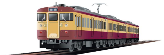
115系懐かしの新潟色