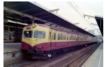
当時の新潟色車両