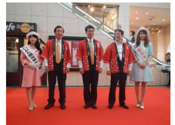
昨年度のセレモニー写真

【産直市】：作付面積・消費量日本一と言われる新潟県の枝豆や南魚沼産コシヒカリの新米、新潟県の加工品、日本酒などの地場産品を販売します。 ※物産品は、天候、交通状況により変更となる場合があります