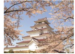
鶴ヶ城公園（イメージ）