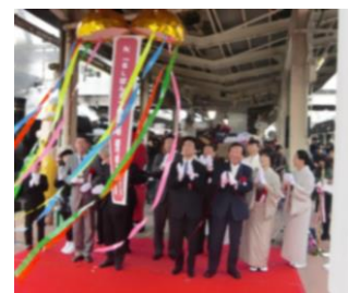
くすだま開花 (イメージ)