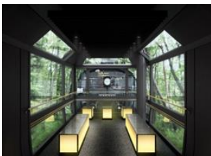
開放感のあるグリーン車両 パノラマ展望室(イメージ)