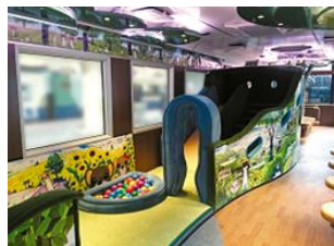
子供に大人気の オコジョ展望車両(イメージ)