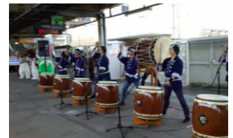
新津駅での秋葉太鼓演奏 (イメージ)