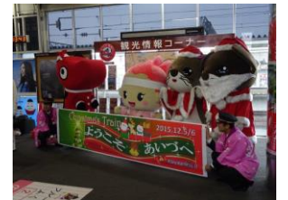
会津若松駅での歓迎 (イメージ)

※実施団体・箇所・内容等については予定です。予告なく変更・中止する場合があります。