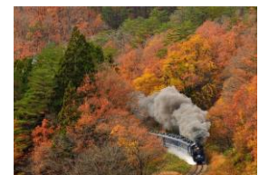
第3回SLフォトコンテスト最優秀賞作品 (イメージ)