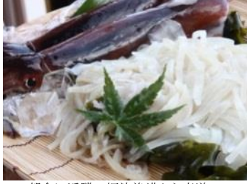
朝食に近隣の姫津漁港から直送の 朝獲れイカ刺し(7月～8月)