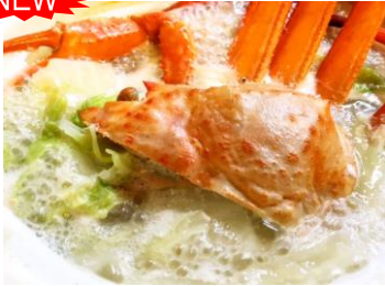
夕食に蟹の旨味がたっぷり 佐渡産ベニズワイ蟹鍋(4月)