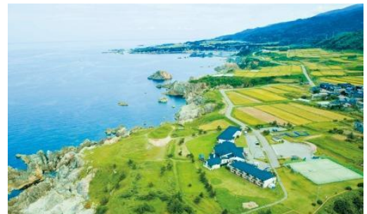
国定公園内に建つ全洋室オーシャンビュー ホテルファミリーオ佐渡相川