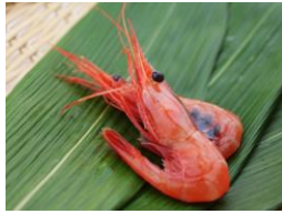
獲れたての弾ける食感 活南蛮エビ(予約制有料)