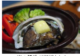
海の旨味が凝縮された あわびの陶板焼き(予約制有料)