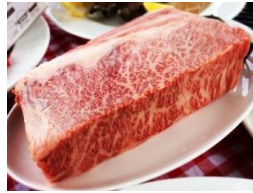
希少価値の高い佐渡牛の バーベキュー(予約制有料)