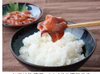
お米は佐渡産コシヒカリの棚田米や 佐渡スーパーコシヒカリ