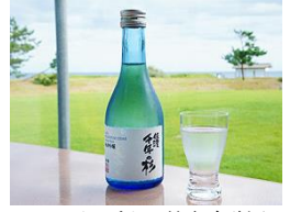
ホテルオリジナル純米吟醸酒 佐渡 千年の杉(有料)