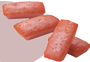
新潟 越後姫フィナンシェ