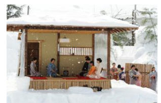
雪上茶席(イメージ)

会場では雪国十日町ならではの素朴なおもてなしや郷土料理、雪上茶席、巨大な雪の滑り台、雪上運動会などをお楽しみいただけます。