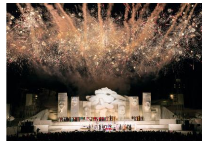
雪上カーニバル(イメージ)