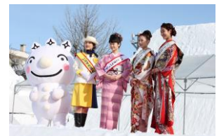
ウェルカムセレモニー(イメージ)