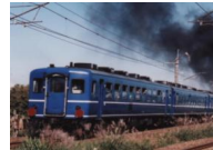
12系青い客車(イメージ)