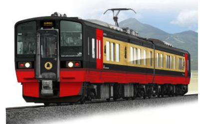
フルーティア(イメージ)