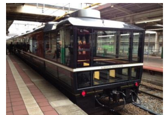
ばんえつ物語客車(イメージ)