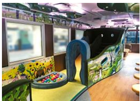
子供に大人気のおコジロウ展望車両 (イメージ)