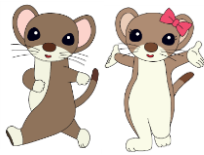
ばんえつ物語キャラクター オコジロウ・オコミ