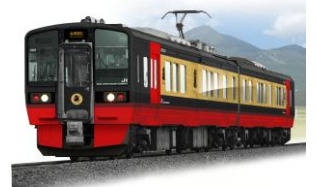
フルーティア(イメージ)