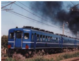
鮮やかな青が魅力の12系客車 (イメージ)