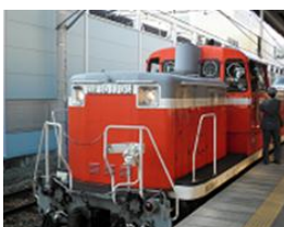
赤い長鼻が特徴のDE10 (イメージ)