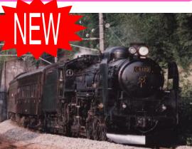
磐越西線初登場となるC61 (イメージ)