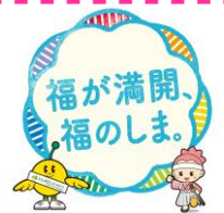
キビタン・八重たん