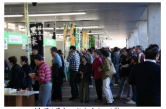
地そばまつり(イメージ)