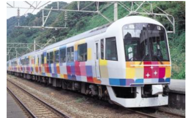
きらきらうえつ(イメージ)