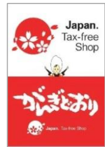
店内装飾イメージ