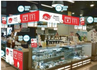
がんぎどおり免税専用レジ店舗イメージ

越後湯沢駅:CoCoLo 湯沢・がんぎどおり内「中央いちば」 (ビジターセンター、食べ歩き横丁、CoCoLo 湯沢店舗除く)