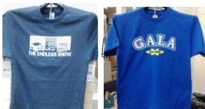
オリジナル T シャツ[表](イメージ)