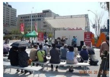
ステージイベント(イメージ)