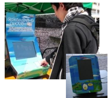
CoCoLo メンバースタッチラリー(イメージ)