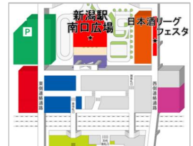
新潟駅会場案内図

各会場に設置してある専用端末に「CoCoLo メンバース」・「Suica」・「りゅーと」いずれかのカードをタッチしスロットに挑戦！抽選で素敵な商品が当たります。