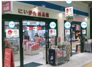
にいがた銘品館店舗イメージ