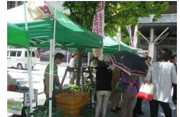
新潟駅南口広場(イメージ)