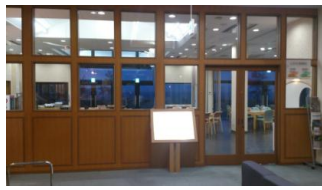
ロビーから日本海を一望