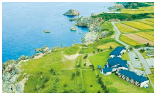
固定公園に建つホテル